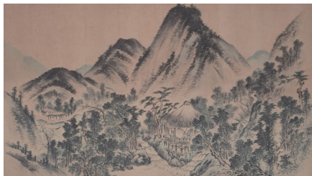
図2 黄葉亭を描いた図。人が集まる開放的なあずまやのイメージだとわかる。（関谷学校蔵、黄葉亭の図。作者不明）