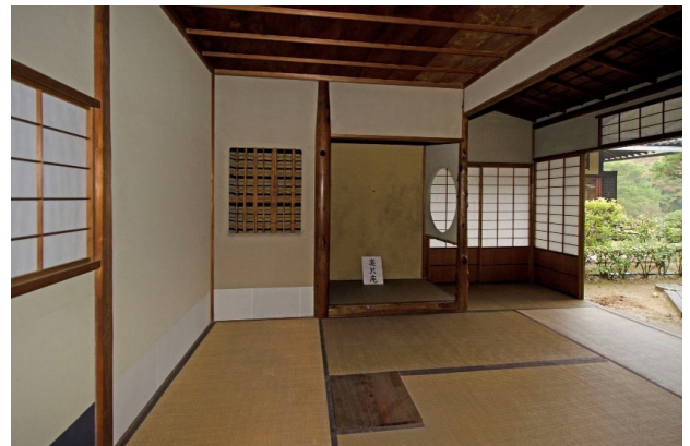
図6 松殿山莊楽只庵 抹茶の茶室としてつくられたものだが、煎茶の会が一度開かれた

煎茶席の意匠があるとされる松殿山莊楽只庵(図6。旧天王寺屋五兵衛邸を移築、大坂の近世の町家、適塾教室(旧天王寺屋忠兵衛邸)に似ている)は、この所有者の高谷宗範が遠州流を学んでいた(のちに山莊流を創設)ため茶の湯のための建築である。煎茶を行っていたのではない。煎茶席は重要な研究だと思うが、誤解を招く表現なので、より良い表現が必要だと考える。文人趣味、あるいは横山正先生が名付けた、「文雅の数寄屋」(横山正:琵琶湖を望む文雅の数寄屋、コンフォルト100号2008/01)という言葉も良い言葉である。