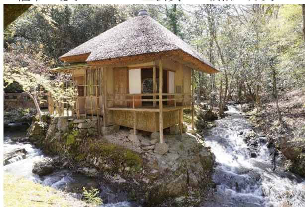
図1 1813年建立の黄葉亭。煎茶席の代表例の一つとされるが、酒宴を開いた記録しかなく、煎茶を飲んだ記録が見当たらない。

1211年に「茶を煎じてのめば、人を眠らせないようにする」（栄西『喫茶養生記』）と、鎌倉時代に茶を煎じて飲む文化があることがわかる。室町時代には、中国