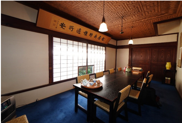
図4 小栗家住宅の煎茶室

家の煎茶席(図4)における腰高の壁を残した開口部や壁床、草野家新座敷の三角形平面の床脇の形態が煎茶会図録(図5)と共通した。